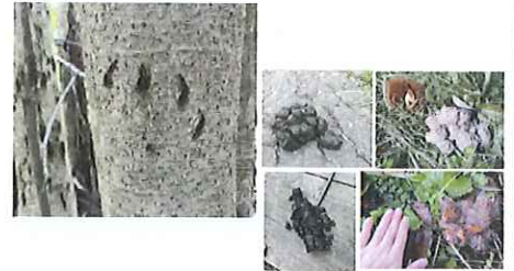
左へ上から：（上段左から）糞、クマ（下段左から）クマの爪、カキ